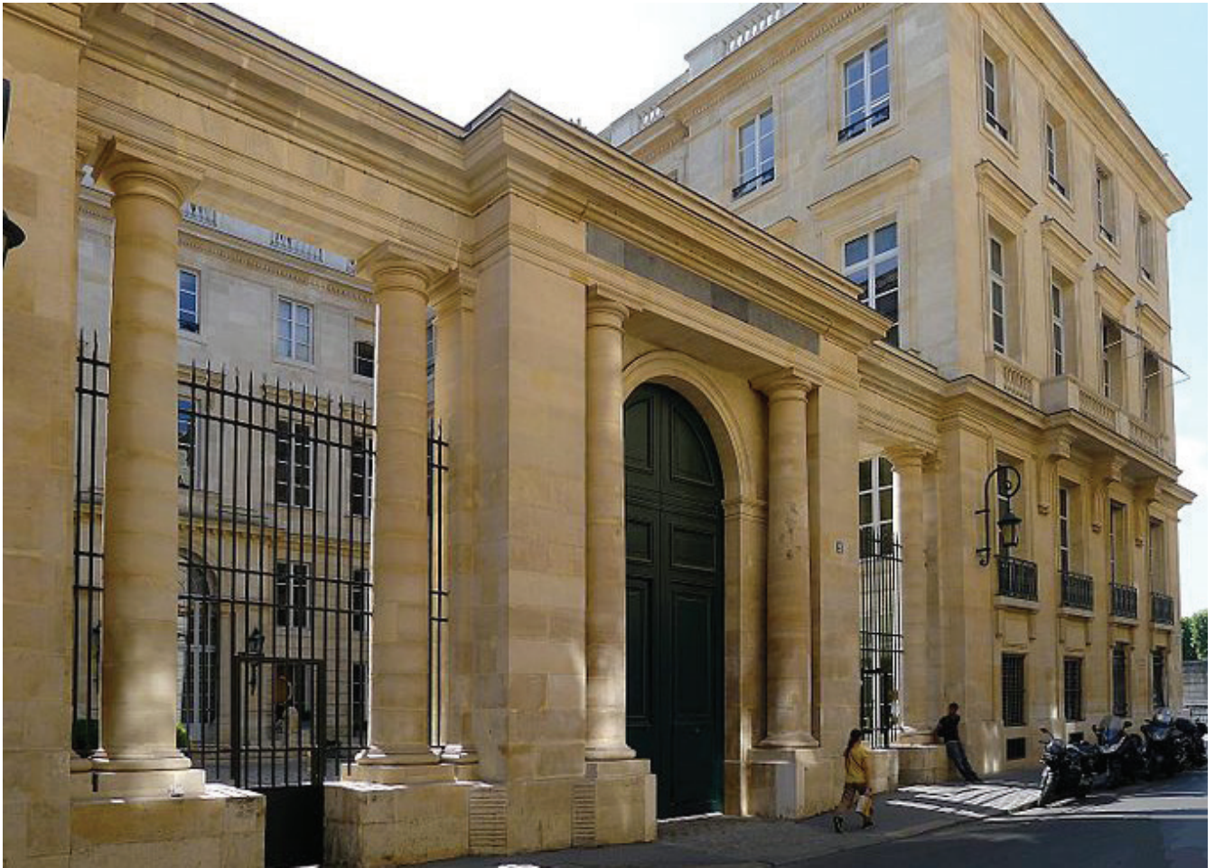
L'Hôtel Talleyrand, aujourd'hui propriété des Etats Unis d'Amérique, a abrité l'administration du Plan Marshall de 1947 à 1952. Il a été rebaptisé pour cette raison George C. Marshall Center