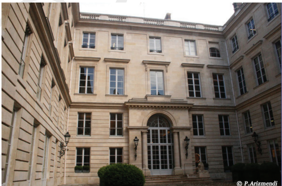
Cours intérieure de l'hôtel Saint Florentin